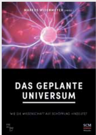
Markus Widenmeyer (Hrsg.): Das geplante Universum Wie die Wissenschaft auf Schöpfung hindeutet 156 Seiten, 20 Abb., 9,99 Euro