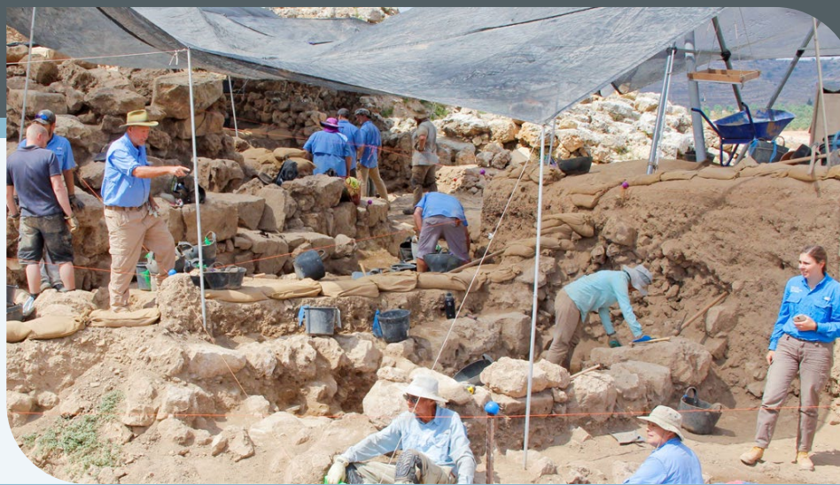
Abb. 2. Grabung auf Tell Schilo