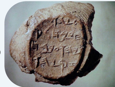
Abb. 3. Tonbulle eines jüdischen Ministers

9.30 h Transitional archaeological periods and the Early History of Israel (P. v.d. Veen) 10.00 h Overlapping Middle Bronze, Late Bronze and Iron Age I (I. Meitlis, Zoom) 10.45 h Overlapping Late Bronze II and Iron Age I (A. Leavitt) 11.30 h Diskussion 12.00 h Mittagessen (danach Abreise) * Übersetzung ins Deutsche